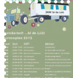
Jugendarbeit ...bi de LÜÜT