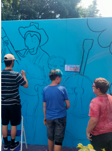
Alle helfen mit - skizzieren der Wände

Der Entwurf überzeugte uns von Anfang an. Nachdem der Werkhof uns grünes Licht gab, konnten wir mit der Umsetzung beginnen.