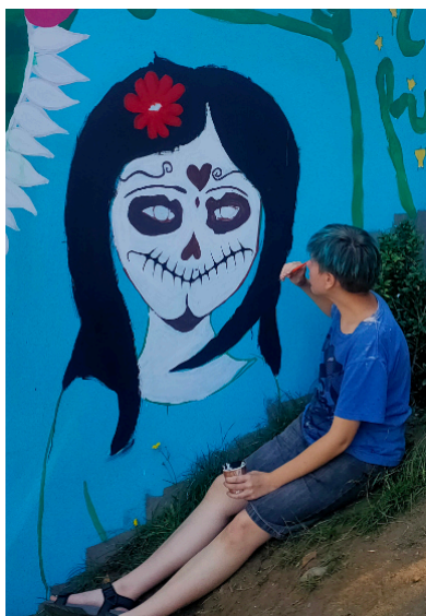
Nach den Flächen - die Details