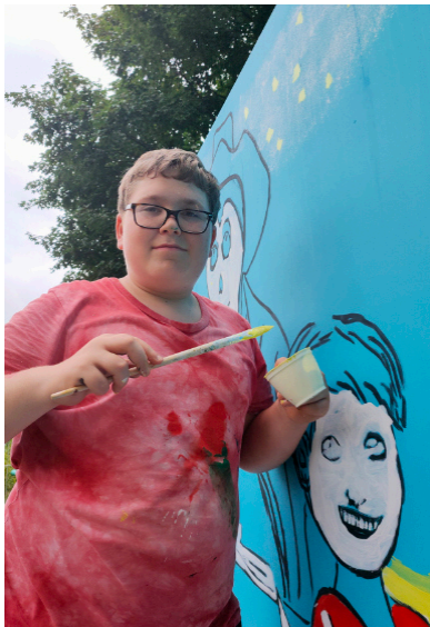
Weiss grundieren, damit die Farben zur Geltung kommen

Am 21. Juni um 9:00 Uhr war dann der Startschuss mit allen Beteiligten. Nun ging es darum, die Idee in die Tat umzusetzen und die WC-Anlage in neuer Pracht erstrahlen zu lassen.