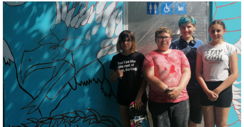
Erschöpft nach dem ersten Tag