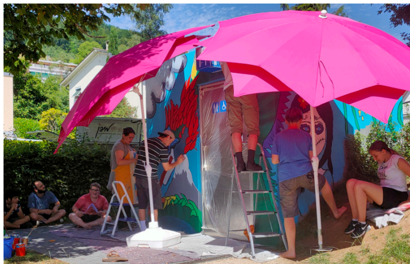
Mit Sonnenschirmen, Glacé und kaltem Sirup geht es bei der Hitze voran

An den darauffolgenden Tagen wurden die farbigen Flächen weiss vorgemalt, damit die Farben besser zur Geltung kommen. Die hellen Flächen wurden so viel kraftvoller und das Kunstwerk begann seine Form anzunehmen. Motiviert durch Lob der Passanten und begeistertes Feedback der Werkhofmitarbeiter, entstand so innert Kürze eine wunderschöne Fassade! Nur gelegentlich von Sommerregen überrascht, hatten wir gutes Wetter, um mit dem Projekt vorwärts zu kommen.