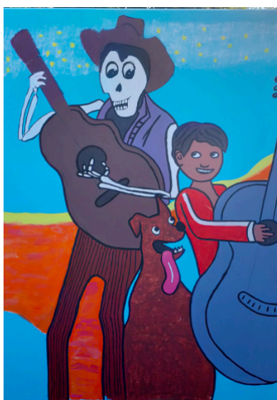
Hmm, da fehlen noch Beine...

An den darauffolgenden Tagen wurden die farbigen Flächen weiss vorgemalt, damit die Farben besser zur Geltung kommen. Die hellen Flächen wurden so viel kraftvoller und das Kunstwerk begann seine Form anzunehmen. Motiviert durch Lob der Passanten und begeistertes Feedback der Werkhofmitarbeiter, entstand so innert Kürze eine wunderschöne Fassade! Nur gelegentlich von Sommerregen überrascht, hatten wir gutes Wetter, um mit dem Projekt vorwärts zu kommen.