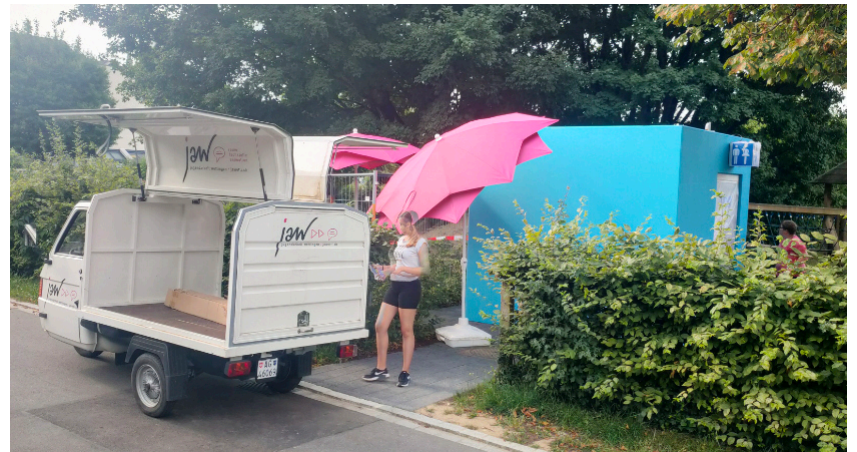
Alles Material abgeladen und eingerichtet

Am ersten Tag wurden die Skizzen der Planung mittels Raster und Kreide auf die Wände übertragen. Anschliessend zogen die Jugendlichen mit verdünnter Fassadenfarbe die Kreideskizzen nach, damit ein allfälliger Platzregen die geleistete Vorarbeit nicht zunichte machen konnte.