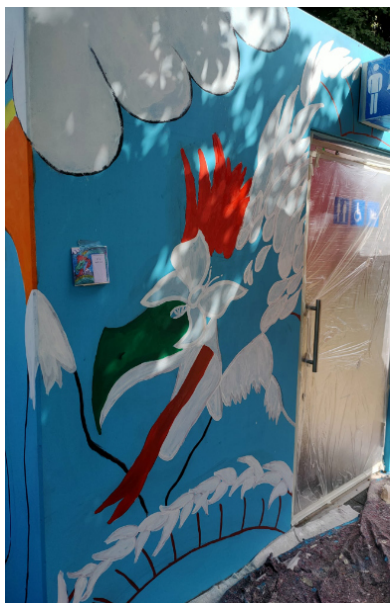
Die Flächen füllen sich