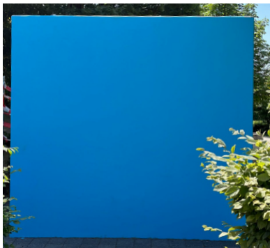
Grundiert in blau

Stolz präsentieren wir euch das Streetart-Projekt beim Spielplatz Rebhalde.