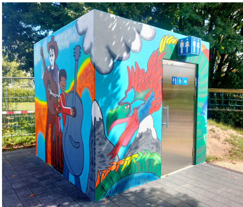
Die fertige Vorderseite des Kunstwerkes

Die Jugendlichen gaben alles und waren bis zum Schluss sehr motiviert. Es hat grosse Freude gemacht zu sehen, wie das Bild täglich, sogar stündlich, mehr und mehr lebendig wurde.