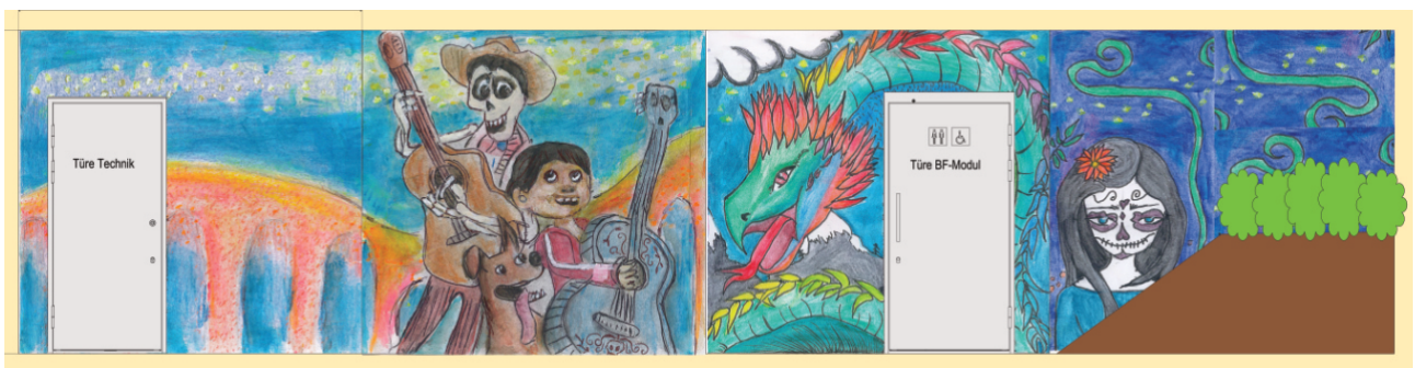
Projekteingabe der Jugendlichen

Trotz unterschiedlicher Meinungen und Vorstellungen, gelang es der Gruppe, sich auf eine gemeinsame Lösung zu einigen.