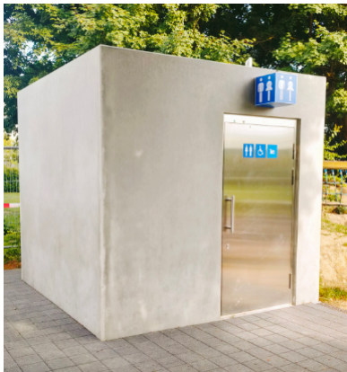
Der Kubus in seiner Rohform