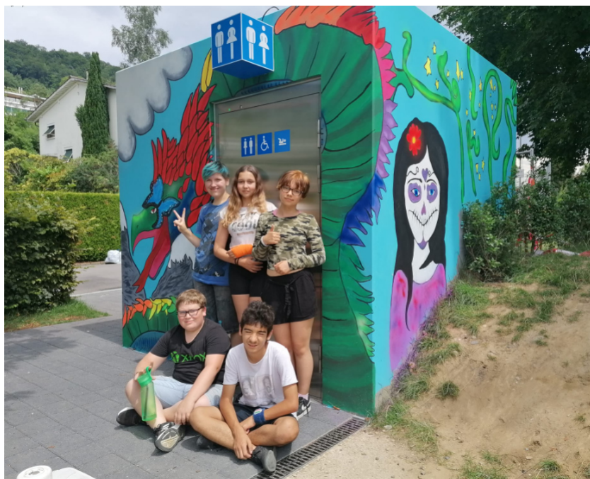
Stolze Jugendliche nach getaner Arbeit

Die Jugendlichen waren besonders stolz auf ihre Teamarbeit, dass es so gut untereinander funktioniert hat und sie sich gegenseitig unterstützt haben. Gestaut haben sie darüber, was in so kurzer Zeit entstehen kann. Nicht vergessen zu erwähnen ist der Drache, der über dem WC-Eingang fliegt.