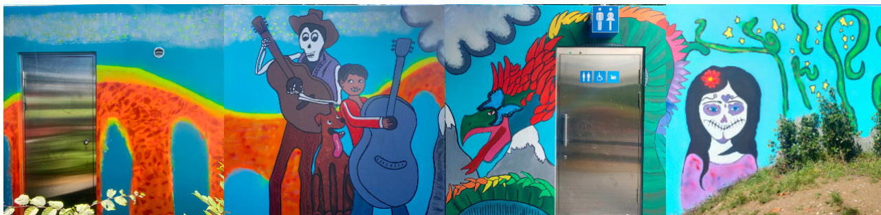
Das fertige Gesamtwerk