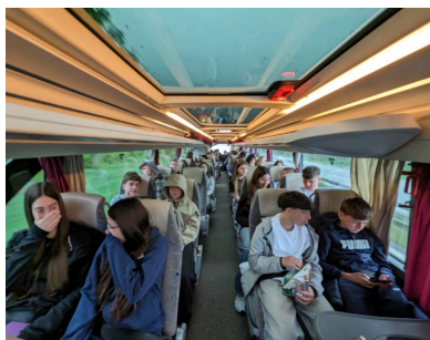
Busreise in den Europa-Park