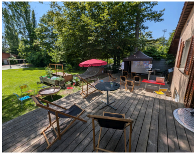
Bereit für die EM-Übertragung