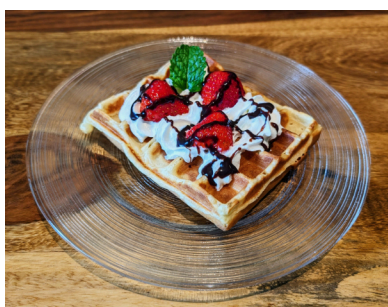
Waffeln im Regen für die Mittelstufe