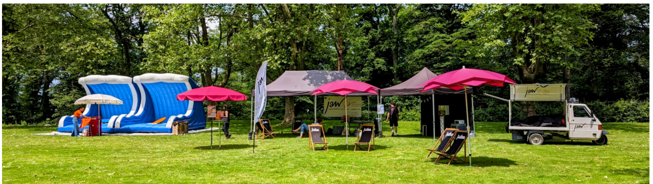
Bereit für die Gäste und das 50 jähriges Jubiläum im Gartenbad Wettingen

Ausserdem bot die «JAW-Erlebniswelt» zahlreiche Spielmöglichkeiten, unter anderem ein Vier-Gewinnt-Spiel in Menschengrösse, diverse Jonglier- und Ballspiele, eine Slackline und eine grossflächige «Chill-Out-Zone» mit bequemen Liegestühlen unter unseren pinken Sonnenschirmen. Die «JAW-Erlebniswelt» war die perfekte Oase für einen abenteuerreichen Sommertag in der Badi. Leider liess das Sommerwetter auf sich warten, weswegen die von uns erwünschten «Menschenmassen» ausblieben. Trotzdem durften wir den anwesenden Gästen ein breites Angebot präsentieren und ihnen ein Lächeln ins Gesicht zaubern.