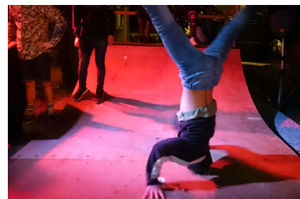
Da steht die Skatergruppe Kopf.