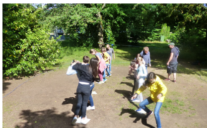
Gruppenübung, der «Lavafluss»